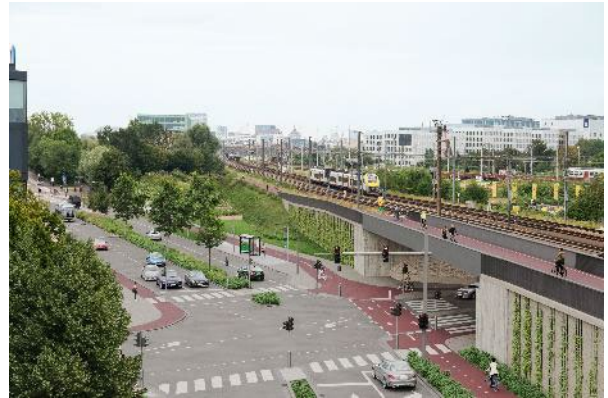
Impressiebeeld van de nieuwe fietsbrug

Daarom bouwen stad Antwerpen en Lantis een verhoogd fietspad met twee fietsbruggen. Dit verbetert het fietscomfort en verhoogt de veiligheid en de oversteekbaarheid.