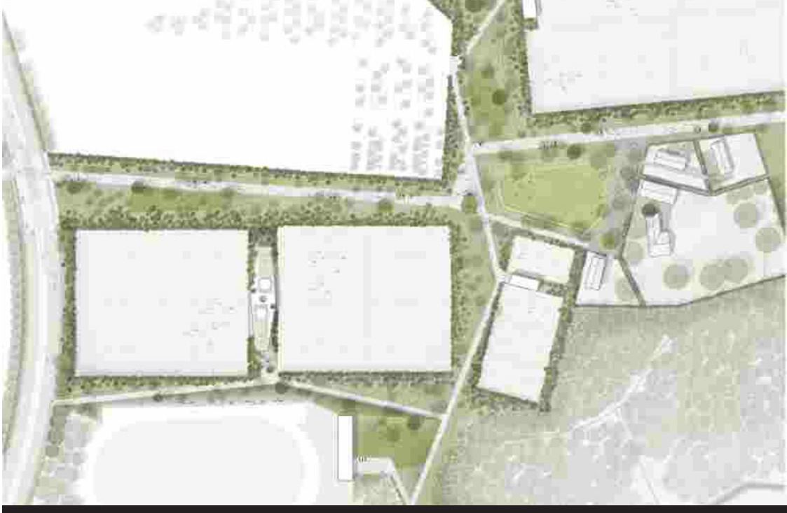
BUUR // Hosper // BULK architecten // ARA