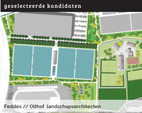
Feddes // Olthof landschapsarchitecten

Het Park Groot Schijn (voormalig gebied Ruggeveld – Boterlaar – Silsburg) is een open ruimte gebied van 83ha gelegen in het oosten van het district Deurne. Het gebied is vandaag een lappendeken van verschillende functies zoals volkstuinten, voetbalvelden, een skipiste, een atletiekpiste, natuurgebied, hondenclubs en verschillende andere kleine verenigingen. Ondanks de vele functies heeft het heden vooral de kenmerken van een restgebied. Voor het gebied werd een masterplan Park Groot Schijn gemaakt door MAXWAN // 1010 // Karres & Brands waarin de ambitie voor het gebied werd vastgelegd. Het masterplan omvat de uitwerking van het ruimtelijk uitvoeringsplan Ruggeveld- Silsburg. AG Stadsplanning wil via een aantal deelopdrachten de verschillende fases van het masterplan vorm geven en realiseren. Concreet gaat het telkens om de doorvertaling van een onderdeel van het masterplan naar een uitvoeringsproject. AG Stadsplanning heeft de ambitie om per deelopdracht de ontbrekende onderzoeksvragen door middel van ontwerpmatig onderzoek verder op te lossen.