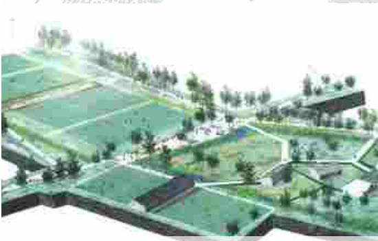
Omgeving // Zwarts & Jansma Architects

Het ontwerp van Buur// Hosper versterkt de structuren zoals vastgelegd in het masterplan en brengt een aantal verbeteringen aan. Er wordt een subtiele hiërarchie in de padenstructuur ingevoerd. De nevenroutes krijgen een verbindende rol tussen de hoofdroute en de parkprogramma's. De oost west hoofdroute leidt naar een nieuw groen parkplein dat de centrale plek zoals voorzien in het masterplan vervangt. Het parkplein heeft zowel stedelijke als landschappelijke kwaliteiten. Er werd in het ontwerp veel aandacht besteed aan de uitwerking van de programmakamers en voegen en de relatie tussen beide. De kamers kaderen de parkonderde-