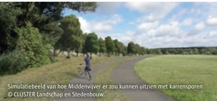
Simulatiebeeld van hoe Middenvijver er zou kunnen uitzien met karrensporen © CLUSTER Landschap en Stedenbouw.

Vooraleer de ontwikkeling van het ruimtelijk uitvoeringsplan van start ging, zijn er al verschillende studies en onderzoeken gedaan. In het kader van het masterplan werden in het verleden al verschillende inspraakinitiatieven georganiseerd. Bij de uitwerking van het ruimtelijk uitvoeringsplan houdt de stad dan ook zoveel mogelijk rekening met de bezorgdheden en de input die voortkwam uit deze overlegmomenten. Ook de resultaten van de reeds gevoerde onderzoeken op vlak van milieu, natuur en mobiliteit worden meegenomen bij de opmaak van dit ruimtelijk uitvoeringsplan.