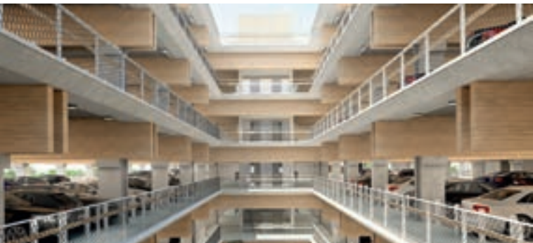
Voetgangers lopen over patio's en zijn volledig gescheiden van het autoverkeer © HUB.

De ambitie is dat de eerste waterbussen zullen varen in de loop van 2017.