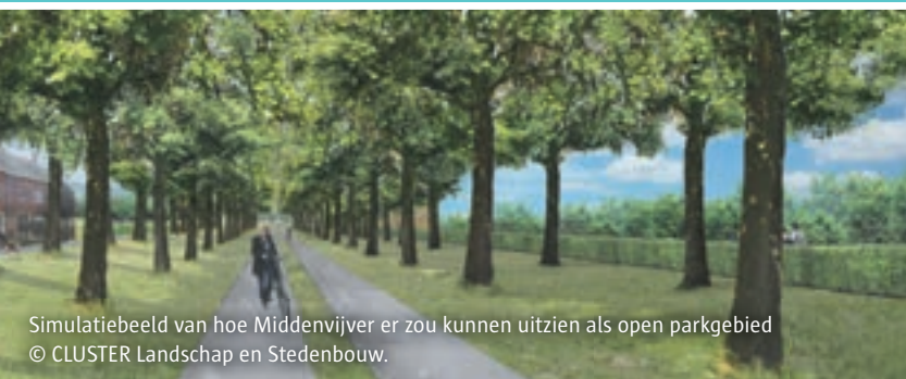
Simulatiebeeld van hoe Middenvijver er zou kunnen uitzien als open parkgebied © CLUSTER Landschap en Stedenbouw.