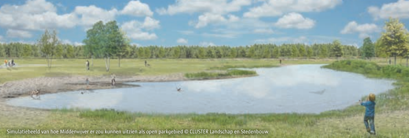
Simulatiebeeld van hoe Middenvijver er zou kunnen uitzien als open parkgebied © CLUSTER Landschap en Stedenbouw.