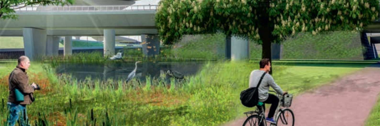
Zicht op de fietsverbinding onder de zuidelijke knoop Antwerpen-West.

Dit parkeergebouw wordt een open constructie van 6 verdiepingen, zonder gevel of dak, gedragen door houten balken. Op termijn zal het gebouw uitgroeien tot een knooppunt van duurzame mobiliteit. De parking op Linkeroever zal plaats bieden aan circa 1500 wagens en 150 fietsen. Er worden ongeveer 150 parkeerplaatsen uitgerust met een e-oplaadpunt en is er ruimte voorzien voor deelauto's en -fietsen.