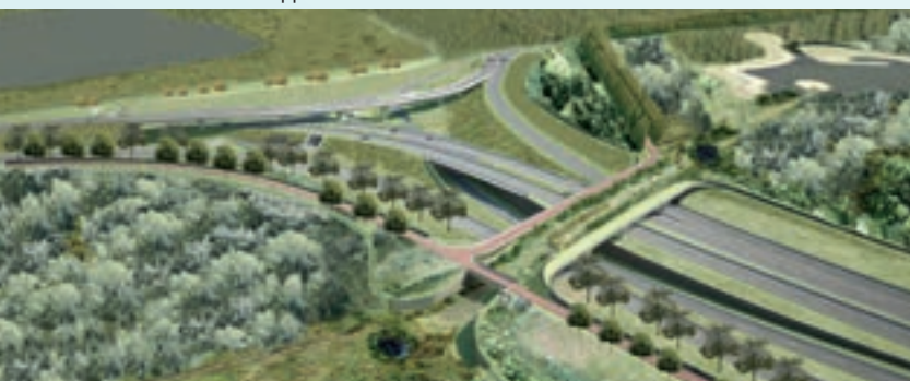
Bovenaanzicht van het knooppunt Sint-Anna Linkeroever.