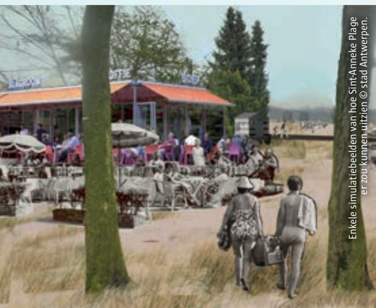
Enkele simulatiebeelden van hoe Sint-Anneke Plage er zou kunnen uitzien © stad Antwerpen.

Op drie plaatsen worden duidelijke hoofdtoegangen voorzien. Twee liggen in het verlengde van de Gloriantlaan en de Charles De Costerlaan. Een derde komt centraal in het gebied te liggen. Zo ontstaat er een rechtstreekse verbinding tussen de Thonetlaan en de aanlegsteiger op de Schelde, waar in de toekomst een halte voor een waterbus kan komen. Omheiningen worden weggehaald en er worden wandel- en fietspaden aangelegd die alle trekpleisters aan de Plage verbinden. Zo ontstaat een open, toegankelijk park langsheen de Schelde.