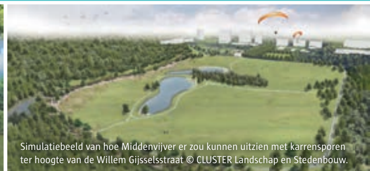
Simulatiebeeld van hoe Middenvijver er zou kunnen uitzien met karrensporen ter hoogte van de Willem Gijselsstraat © CLUSTER Landschap en Stedenbouw.