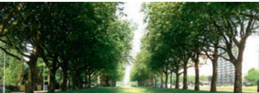
Charles De Costerlaan Linkeroever