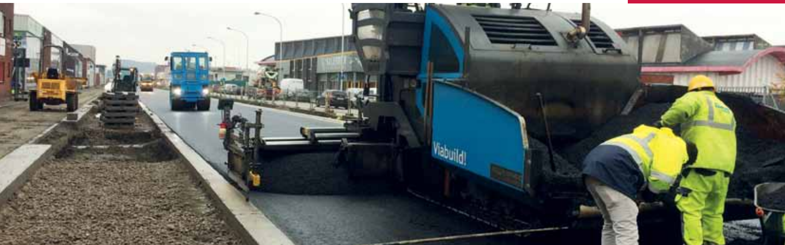
Het asfalteren van de kant Lobroekdok