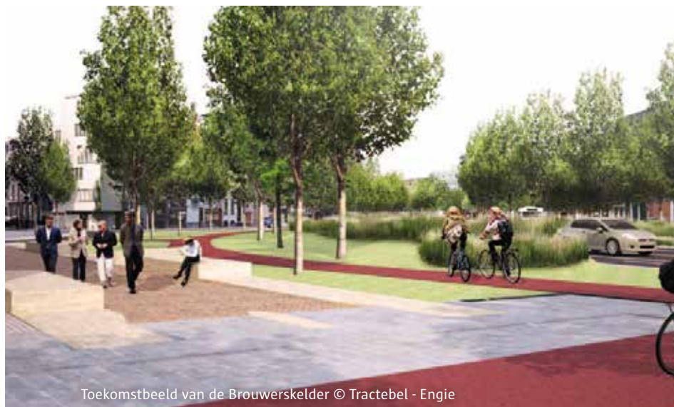
Toekomstbeeld van de Brouwerskelder

Op de Italiëlei gaan de laatste parallelwegen tussen de Cassiersstraat en de Ellermanstraat deze zomer in gebruik. Voor de tram is het nog iets langer geduld uitoefenen. Die maakt zijn opwachting in het najaar.