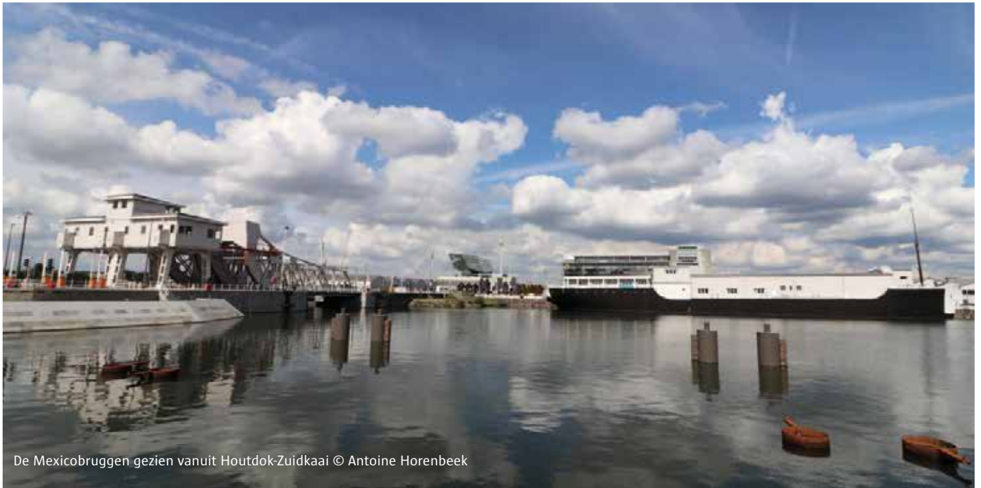
De Mexicobridgen gezien vanuit Houtdok-Zuidkaai