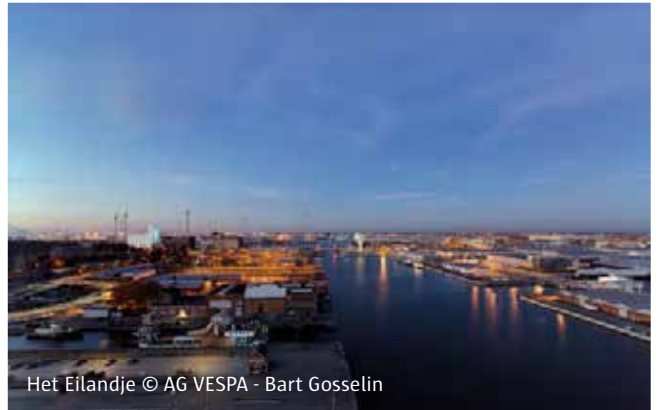
Het Eilandje