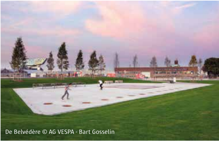
De Belvédère