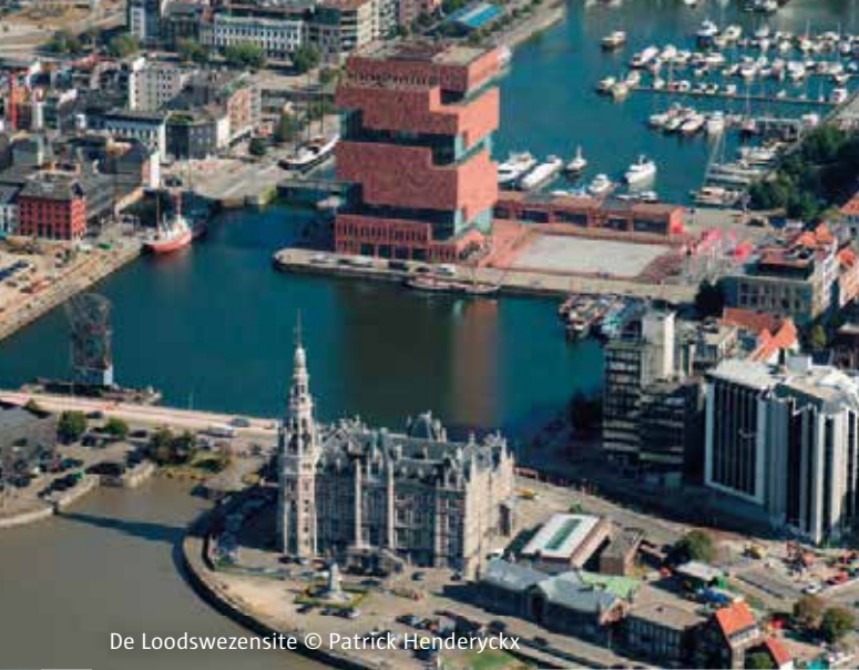
De Loodswezensite