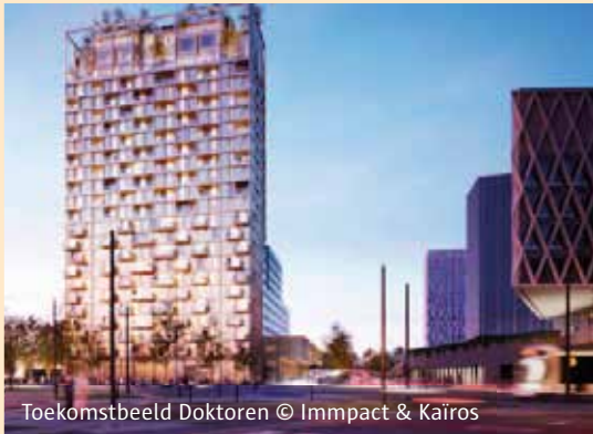
Toekomstbeeld Doktoren © Impact & Kairos

Tussen de Kempenstraat en het viaduct Noorderlaan, net onder het Kempisch dok, realiseren Impact en Kairos het nieuwe project 'Doktoren'. Deze woontoren is een van de sluitstukken van de herontwikkeling van het ruimere projectgebied Kop Spoor Noord. Dankzij de insprong op de lagere verdiepingen vormt het gebouw een mooi geheel met het nieuwe ziekenhuis. Aan de voet van de toren wandelt u recht de groene Kempenstraat op. Een gemeenschappelijke daktuin geeft prachtig uitzicht over de stad, de Schelde of het dok. Meer info vindt u op www.doktoren.be .