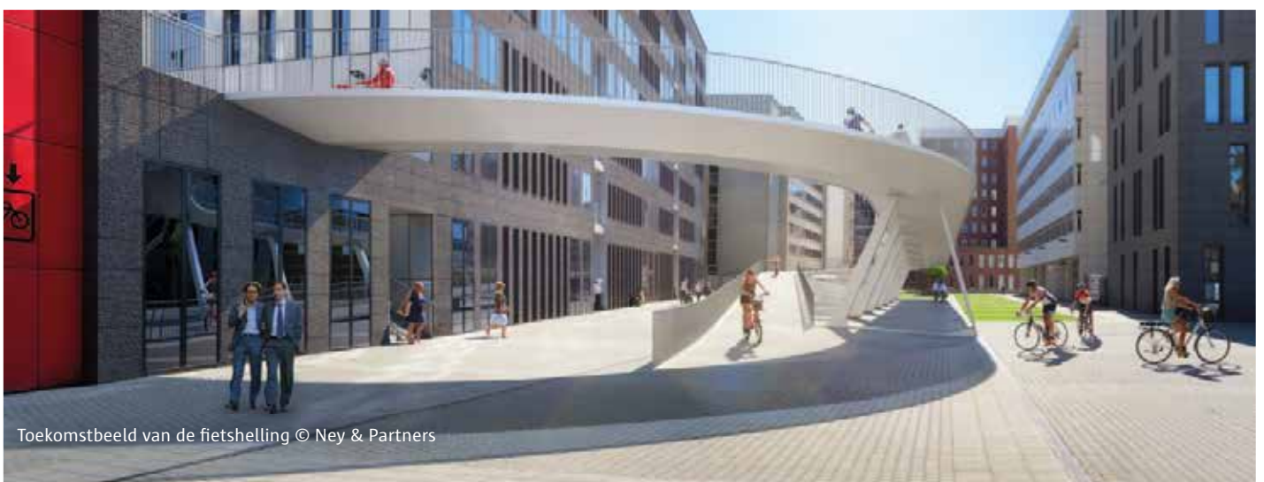
Toekomstbeeld van de fietsstelling © Ney & Partners