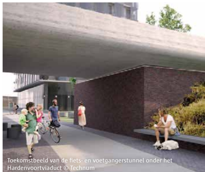
Toekomstbeeld van de fiets- en voetgangerstunnel onder het Hardenvoortviaduct

Of gaat u liever even zitten op een bankje aan de oude Brouwerskelder? Ook dat is een mogelijkheid. De omtrek en de ligging van het 16de-eeuwse waterreservoir wordt zichtbaar gemaakt op de hoek van de Ankerrui