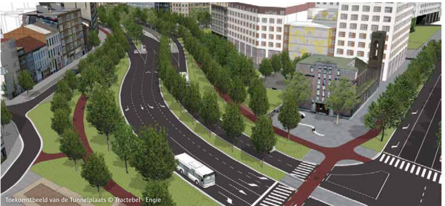
Toekomstbeeld van de Tunnelplaats

met de Italiëlei. Het reservoir werd vroeger gevuld met water uit de stadsgracht. Een gemetselde leiding voerde het water verder naar het Waterhuis.