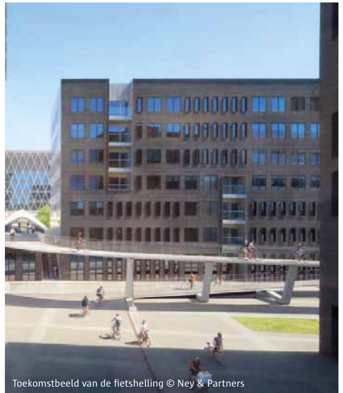
Toekomstbeeld van de fietsstelling © Ney & Partners

De eerste maanden vinden de werken plaats in een atelier. In het najaar starten ook de voorbereidende werken op het terrein. Daarna wordt de helling in verschillende delen naar Antwerpen vervoerd en gemonteerd. Tegen het najaar van 2020 zal de helling klaar zijn voor gebruik.