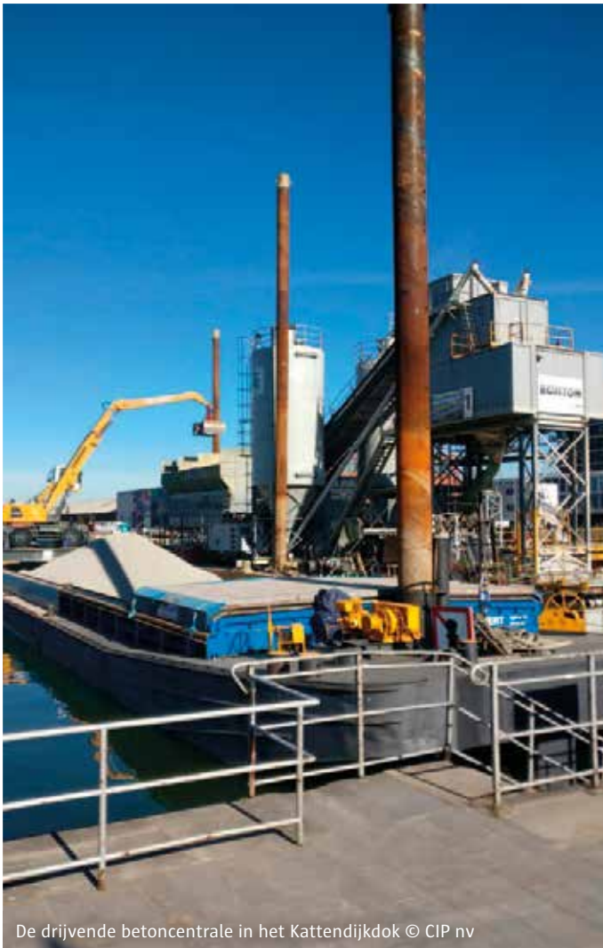
De drijvende betoncentrale in het Kattendijkdok

Dit jaar starten er opnieuw enkele projecten. Het Havenbedrijf zal het laatste deel van de kademuur aan het Kempisch dok vernieuwen. Daarna start AG VESPA met de aanleg van het openbaar domein van deze verlaagde kade aan het water en met de aanleg van een tweede speeltuin op de kade Binnenvaartstraat. Ook de Cadixstraat, de Rigasstraat, de Genuastraat en de Kempischdok-Westkaai (de binnenstraten) worden heraangelegd. De voorbereidingen voor de heraanleg van de tweede fase van het Schengenplein (het deel aan het water), starten, net zoals die voor de aanleg van de New Yorkkaai aan het Kattendijkdok. Ook de ontwikkeling van enkele bouwpercelen wordt voorbereid.