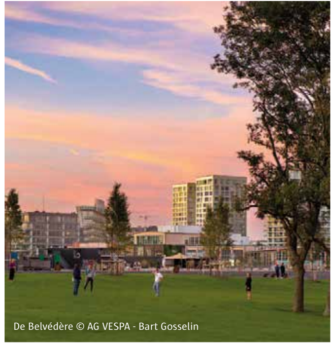
De Belvédère