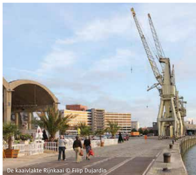
De kaavlake Rijnkaai

Om een kwalitatieve integratie van de waterkering in de publieke ruimte te verzekeren, zal bij de heraanleg de kaavlake kunnen verhoogd worden waardoor de kaairand lager zal komen te liggen dan de toekomstige kaavlake. De nieuwe