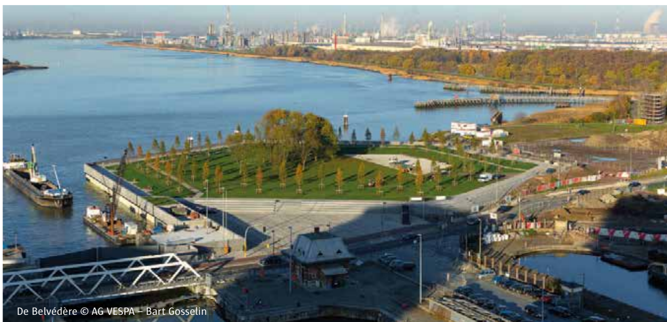
De Belvédère

In april opent een nieuwe (tijdelijke) hondenloopzone op het Droogdokken-eiland. De loopzone van 1800 m 2 bevindt zich tussen de Belvédère in het Droogdokkenpark en Stormkop. In april opent de eerste helft, de zone met zand en speeltuigen. Later, wanneer het gras voldoende ingeworteld is, opent ook de andere helft. Bij aanvang van de werken van de tweede fase van het Droogdokkenpark, gepland over enkele jaren, zal de hondenloopzone meer richting het noorden schuiven.