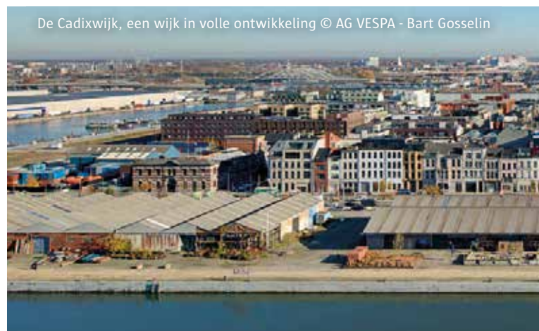
De Cadixwijk, een wijk in volle ontwikkeling