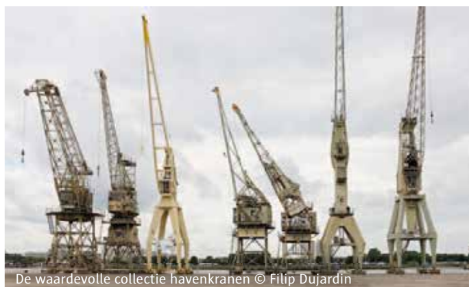
De waardevolle collectie havenkranen

Er komt een verkeersveilige verbinding van de kaavlake met de kaaiweg, net zoals een nieuwe extra aantakking op het kruispunt Rijnkaai met de Londen-Amsterdamstraat. Het huidige gebruik van grote delen van de kaaien als parking wordt behouden als overgangmaatregel in afwachting van een definitieve parkeeroplossing afgestemd op de kaaimuurstabilisatie. De toekomstige parking kan als een ondergrondse parking of als een parkeergebouw. Een parkeergebouw bestaat uit maximaal één bouwlaag met een verplicht publiek toegankelijk dak.