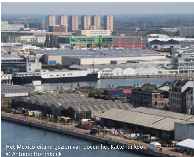
Het Mexico-eiland gezien van boven het Kattendijkdok

is er achterhaald welke functies daar het best thuishoren. Nu zoekt de stad met proefprojecten uit wat werkt en wat niet, kijkt ze naar bestaande initiatieven en zal ze er ook zelf nieuwe opstarten.