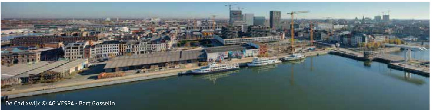
De Cadixwijk