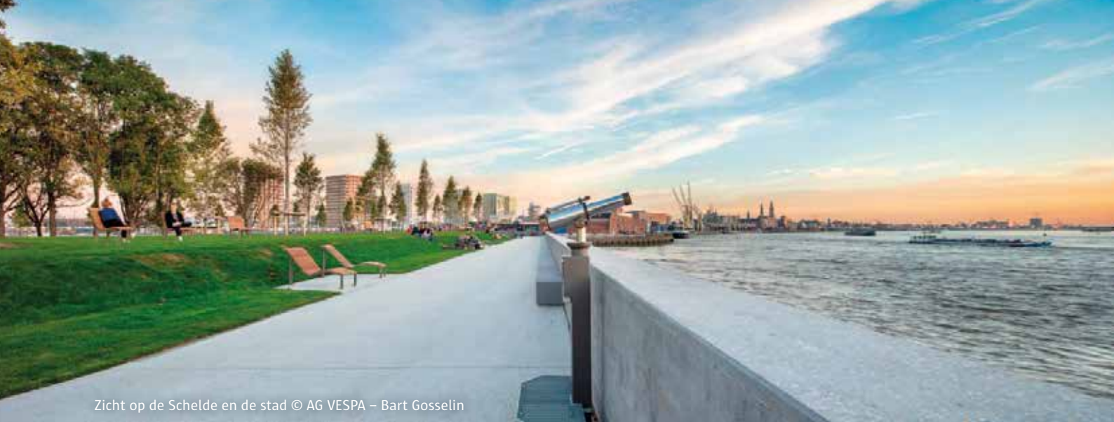
Zicht op de Schelde en de stad