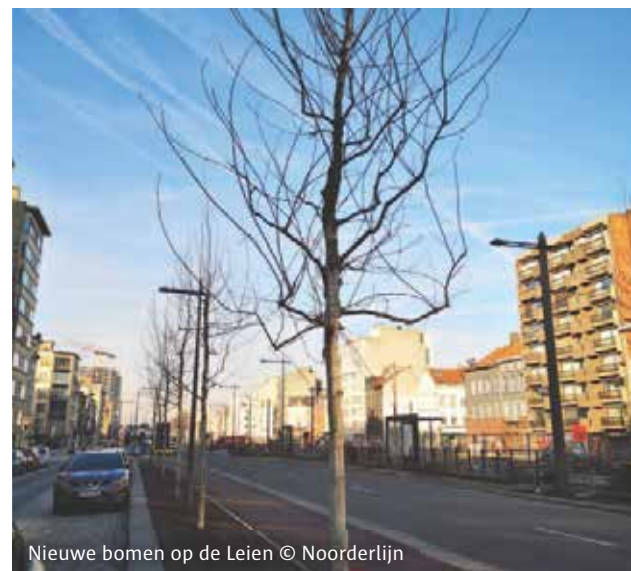
Nieuwe bomen op de Leien