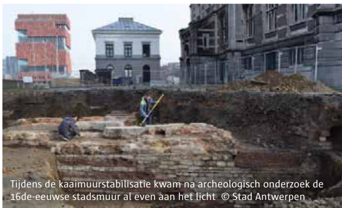
Tijdens de kaaimuurstabilisatie kwam na archeologisch onderzoek de 16de-eeuwse stadsmuur al even aan het licht

In januari is De Vlaamse Waterweg nv gestart met de renovatie van de historische kaaimuur aan de Tavernierkaai en de Van Meterenkaai, waar de historische toegang tot het Bonapartedok en het beschermde Loodswezengebouw liggen. De muur wordt er gestabiliseerd, zonder aan het authentieke uitzicht te raken. De stabiliteitswerken zullen ongeveer twee jaar duren. Tijdens de stabilisatiewerken wordt er heel wat grond uitgegraven en afgevoerd. De Vlaamse Waterweg nv zet daarbij maximaal in op transport over het water. Toch is enige hinder door de werfactiviteiten en het werfverkeer voor de buurtbewoners onvermijdelijk. In een latere fase volgt de aanleg van een nieuwe waterkering en een heraanleg van het openbaar domein. Meer informatie vindt u in de infokeet aan de Tavernierkaai. Die is elke derde woensdag van de maand open, telkens van 12 tot 20 uur. Meer informatie over de kaaimuurstabilisatie leest u op de website van het Sigmaplan ( www.sigmaplan.be/nl/projecten/antwerpse-scheldekaaien ).