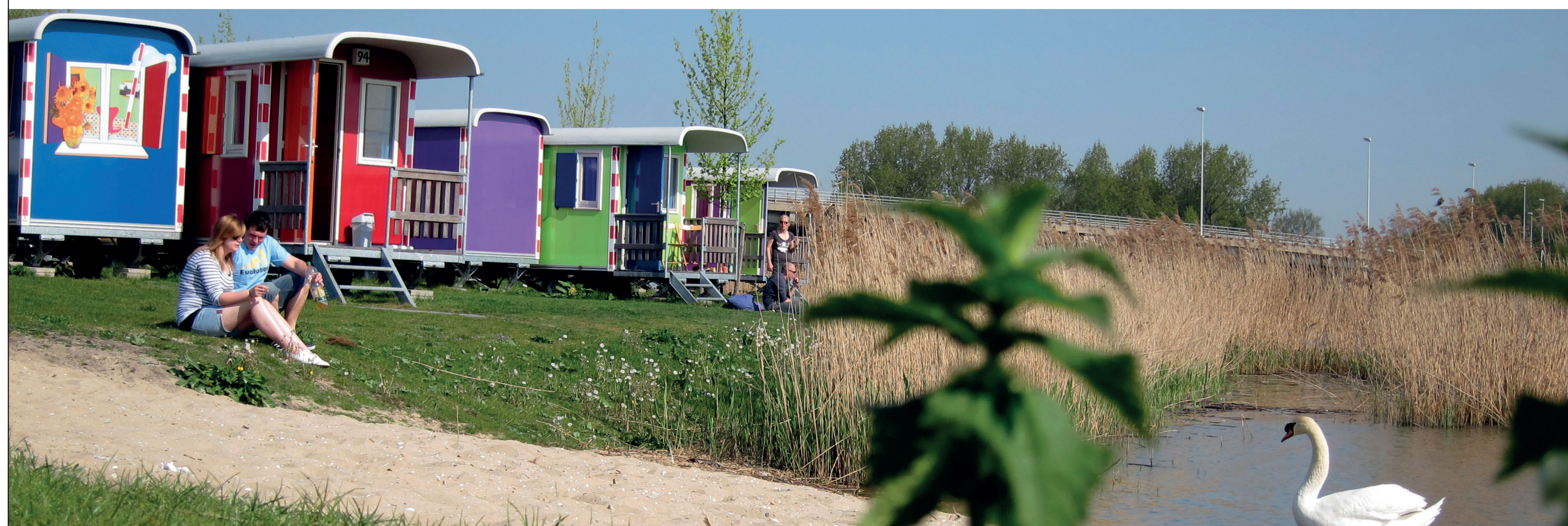
Sfeerbeeld van de stadscamping in Amsterdam.