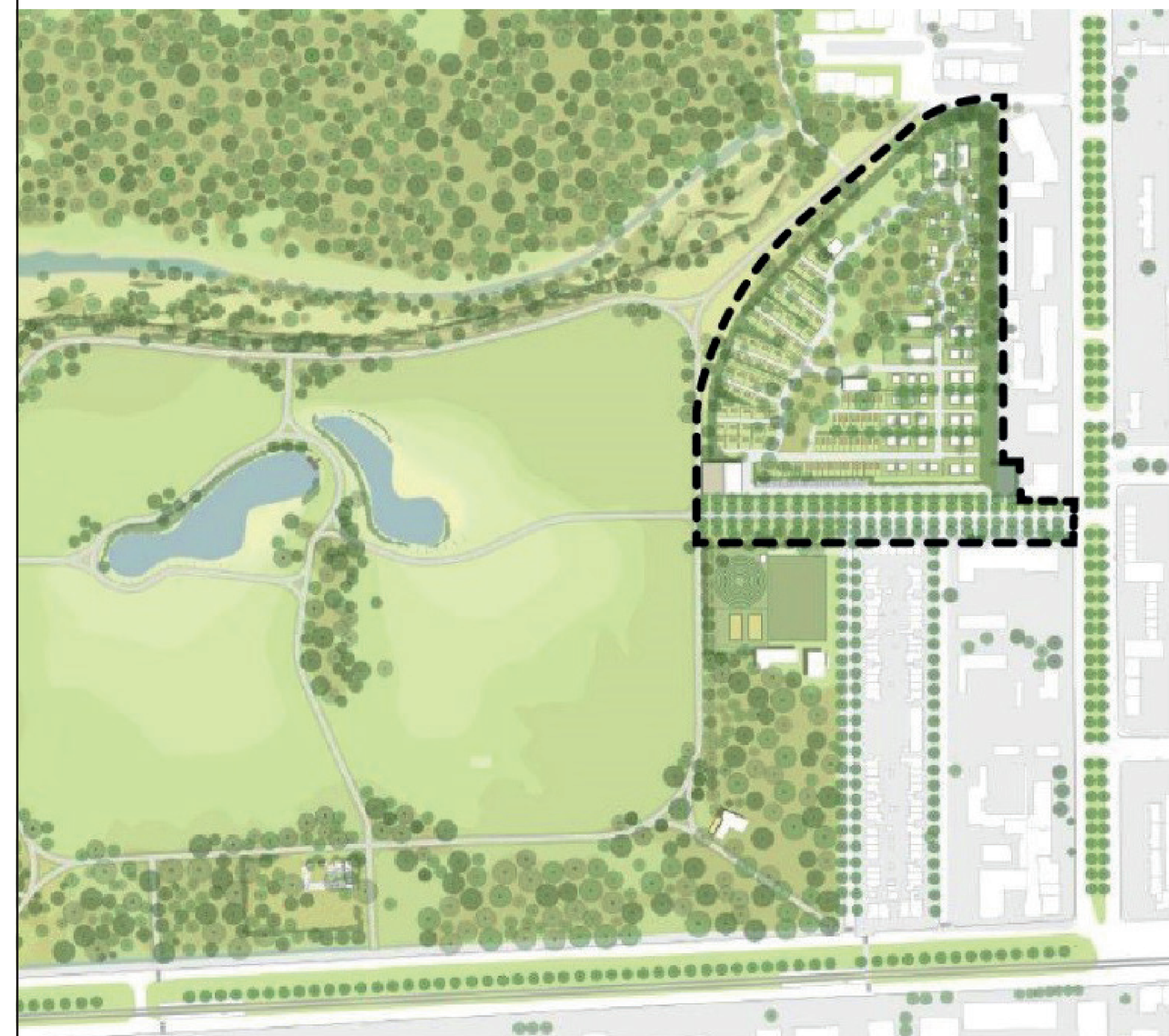
Plangebied van RUP Stadscamping op Linkeroever naast park Middenvijver, omlijnd met een zwarte stippellijn. © ontwerp Inrichtingsvisie Middenvijver

De stadscamping krijgt haar locatie in de noordoostelijke hoek van Middenvijver, op een oppervlakte van ongeveer 5 hectare. Ten noorden van het plangebied ligt de Paul Housmansstraat met aanpalende appartementsgebouwen. In het oosten grenst het gebied aan de bebouwing in de Halewijnlaan en in het westen aan park Middenvijver. De zuidelijke grens wordt gevormd door de Willem Gijsseisstraat. Dat ziet u op de afbeelding links.