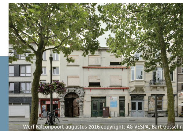
Werf Falconpoort augustus 2016

Meer info: www.deschilden.be , www.agvespa.be