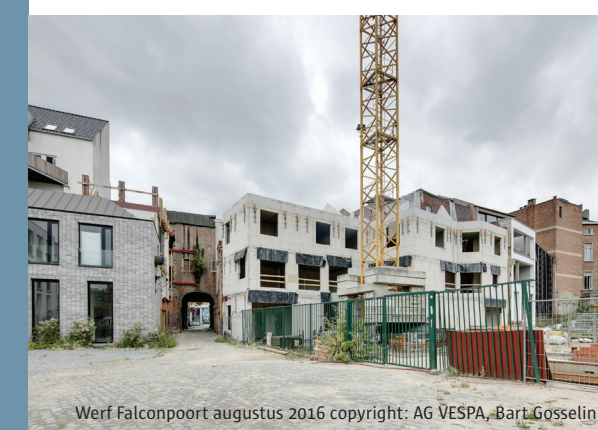
Werf Falconpoort augustus 2016