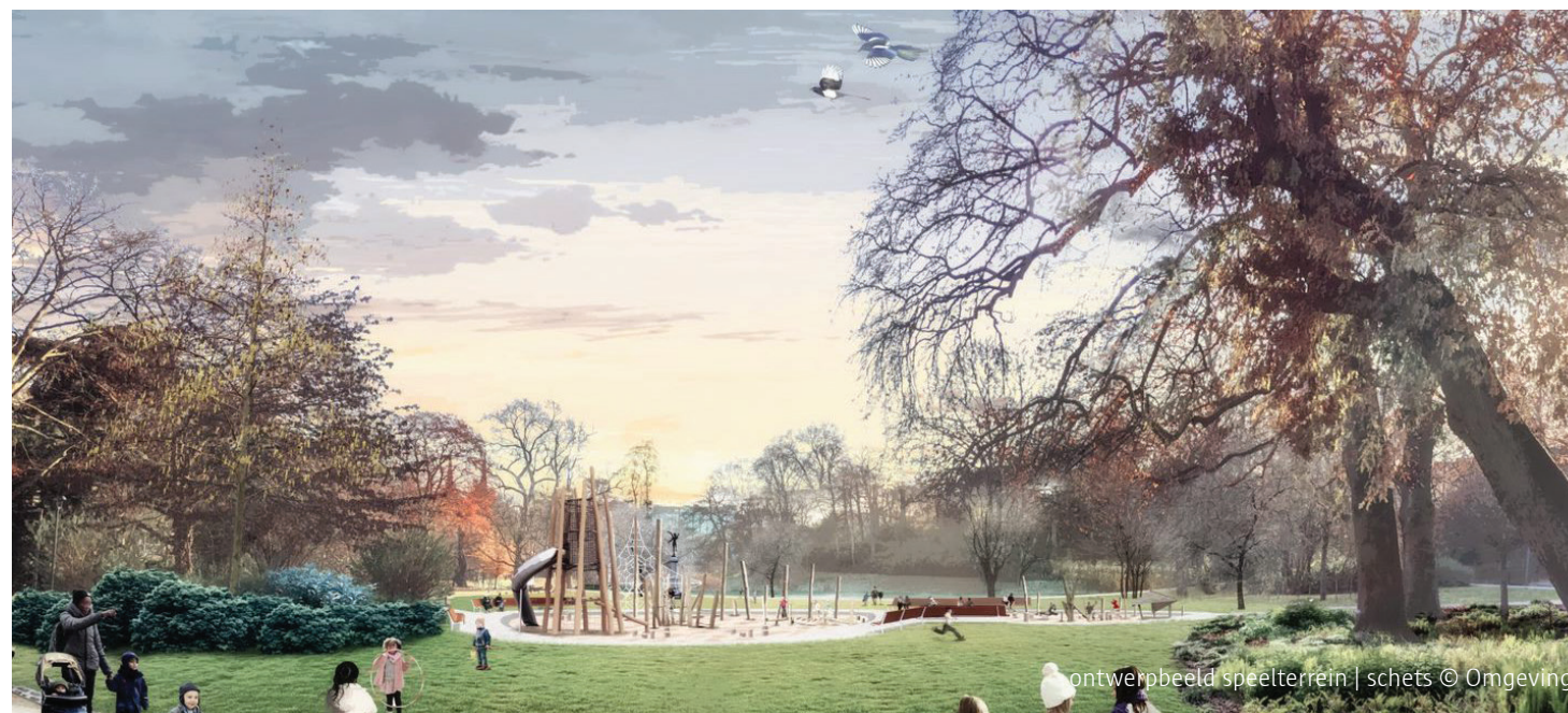
ontwerpbeeld speelterrein | schets © Omgeving