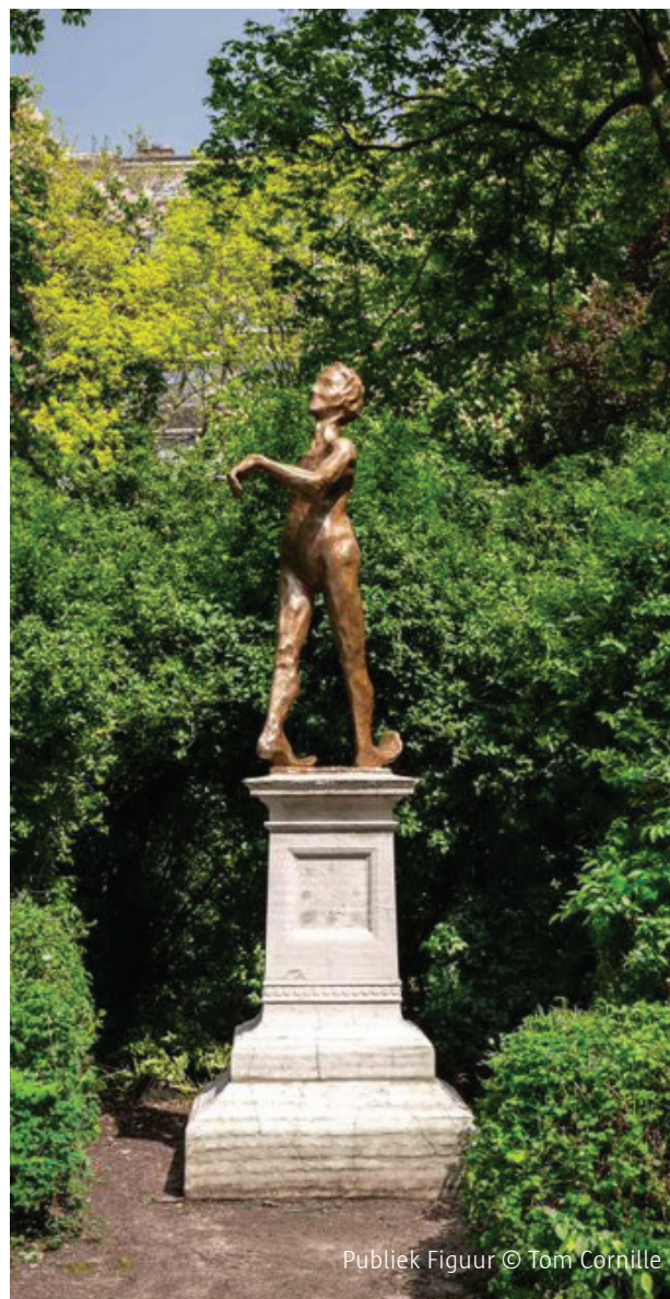
Publiek Figuur