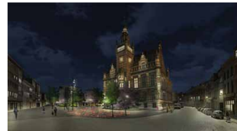
Impressie voorontwerp lichtontwerp Moorkensplein in het weekend.

De speelfontein benadrukt de nieuwe ingang voor alle administratieve diensten aan de zijkant van het districtshuis. De hoofdingang van het districtshuis blijft voorbehouden voor ceremonies. Ceremoniewagens en leveranciers kunnen nog steeds het plein oprijden.