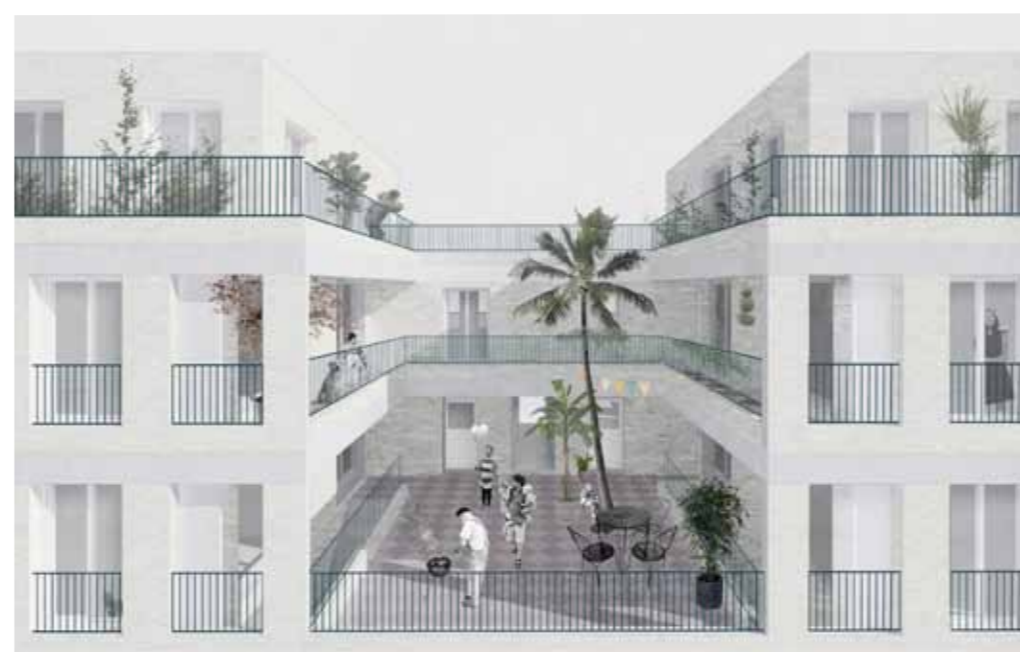
Wedstrijdbeeld - dakterras 1ste verdieping © Haerynck Vanmeirhaeghe architecten

De ontwerpers, Haerynck Vanmeirhaeghe architecten, werken momenteel verder aan het voorontwerp. Nieuwe beelden