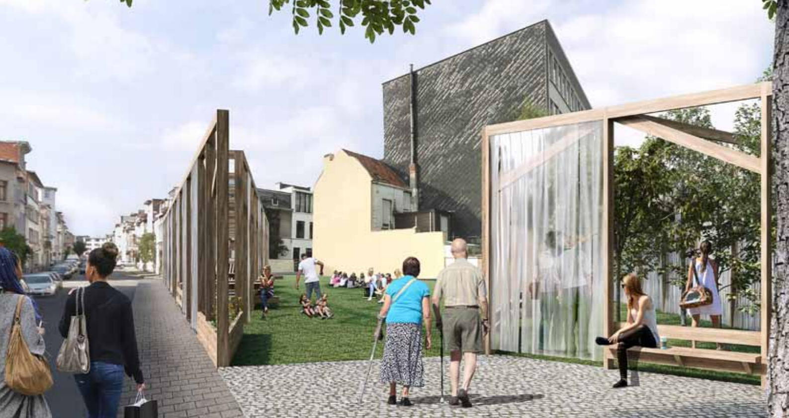
Impressie inrichting tijdelijke groene ruimte aan de Langstraat. Zicht van onder onder de huidige boom.