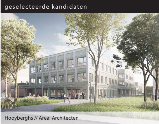
Hooberghs // Areal Architecten

Met dit bouwproject wenst GO! een definitieve situatie te creëren voor Freinetschool De Pluim waar naast de basisschool ook een middenschool wordt voorzien. De nieuwe school zal een capaciteit hebben voor 192 kleuters (8 klassen), 288 leerlingen lagere school (12 klassen) en 96 leerlingen middenschool (4 klassen). De school wenst intensief samen te werken met de andere aanwezige scholen op de site. Daarom bestaat de opdracht naast de architectuuropdracht voor de school ook uit de opmaak van een masterplan. Uitgangspunten hierbij zijn een duidelijke leesbaarheid van de site met herkenbaarheid van De Pluim en KA Hoboken, een zachte as doorheen het volledige domein, logische looplijnen voor de verschillende scholen en andere gebruikers naar de sporthal en aanpalend keukengebouw en een gemeenschappelijke cafetaria.