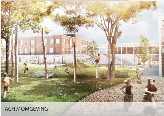
ACH // OMGEVING