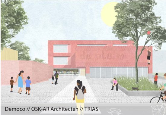
Democo // OSK-AR Architecten // TRIAS