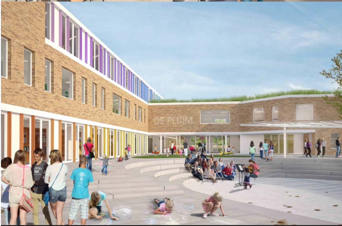
Bouwbedrijf Dethier // A33 Architecten